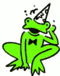
Festa de Nadal UOC 2001